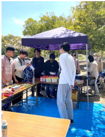
民青同盟奈良県委員会による 香芝市での食料支援活動

【携帯】080-4243-6370 【E-mail】tukasa55122000@yahoo.co.jp