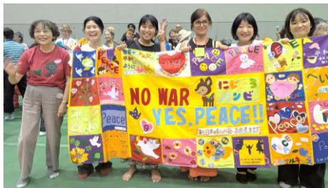
原水禁大会広島デー集會に参加されたみなさん。新婦人奈良県本部の「NO WAR」のタペストリーも笑顔もステキです。