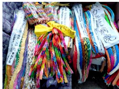
奈良のみなさんから託された16本の千羽鶴を長崎の平和公園に奉納