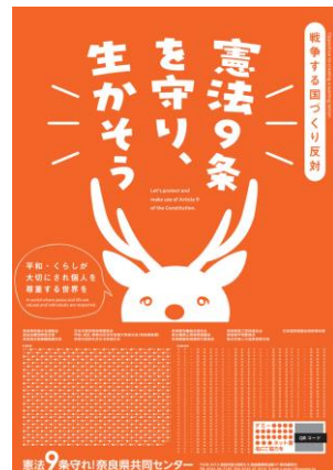
今回の意見広告ポスター