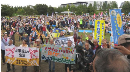
精華町に全国から2700人が参集。京都府南部としても最大規模の大集会となりました。

「私たちは二度と戦争をしたくない!平和でこそ文化は香り立つ!祝園全国集会」が10月19日、精華町のけいはんな記念公園芝生広場で行われ、奈良県から約2700人が参加。祝園弾薬庫新設に反対する集会として最大規模の集会となりました。地元京都をはじめ沖縄、大分、熊本、広島、兵庫、静岡、愛知、神奈川から急速に進む戦争準備に対峙する運